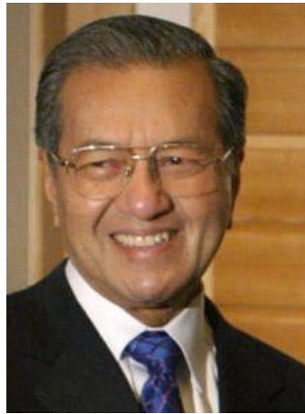
Dr Mahathir bin Mohamad